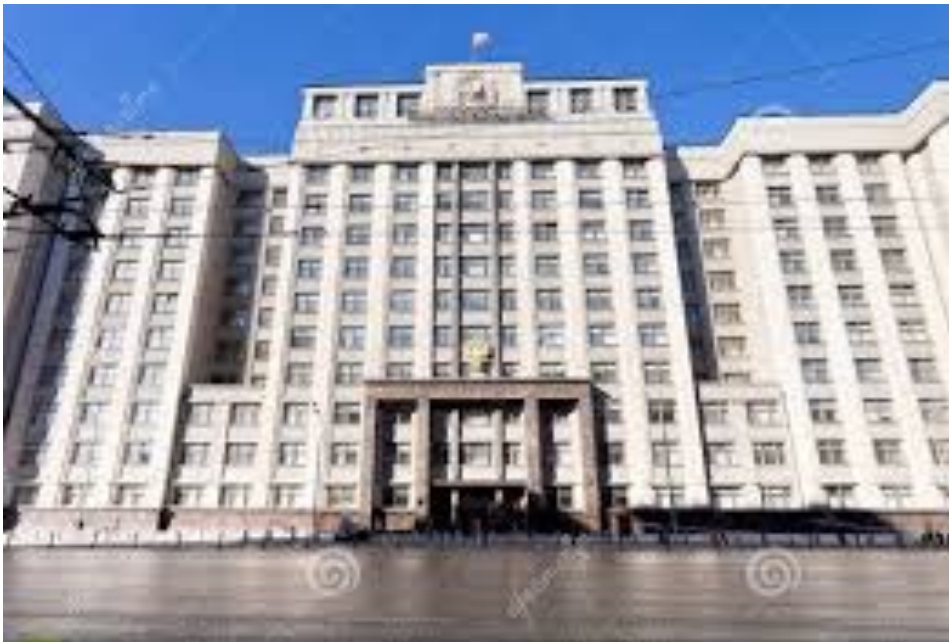
Дума (российский парламент)