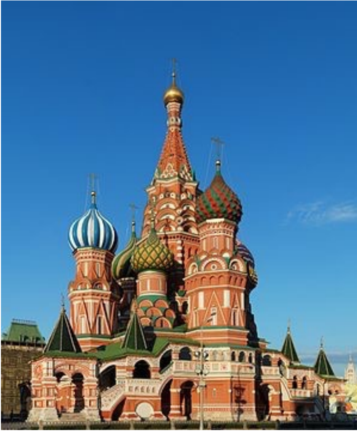
Собор Василия Блаженного