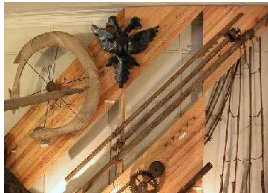
Переславль – Залесский. Корабельные снасти в музее-усадьбе «Ботик Петра I»