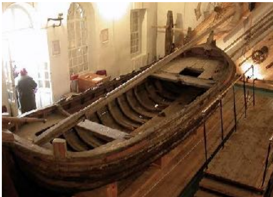
Переславль - Залесский. Бот «Фортуна» в музее-усадьбе «Ботик Петра I»