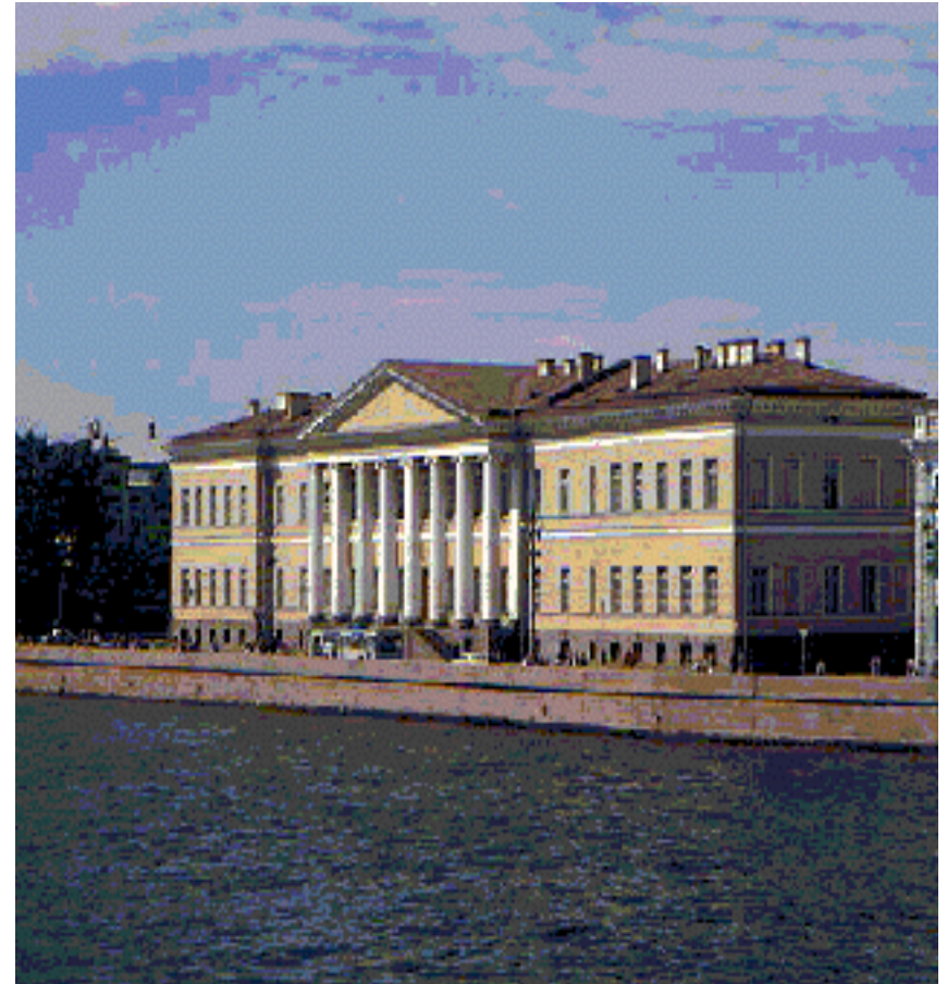
Здание Академии наук в Петербурге