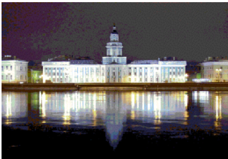
Здание Кунсткамеры. Петербург.