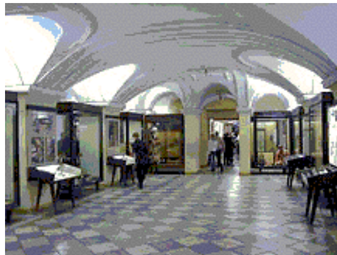
В зале музея. Петербург. Кунсткамера.