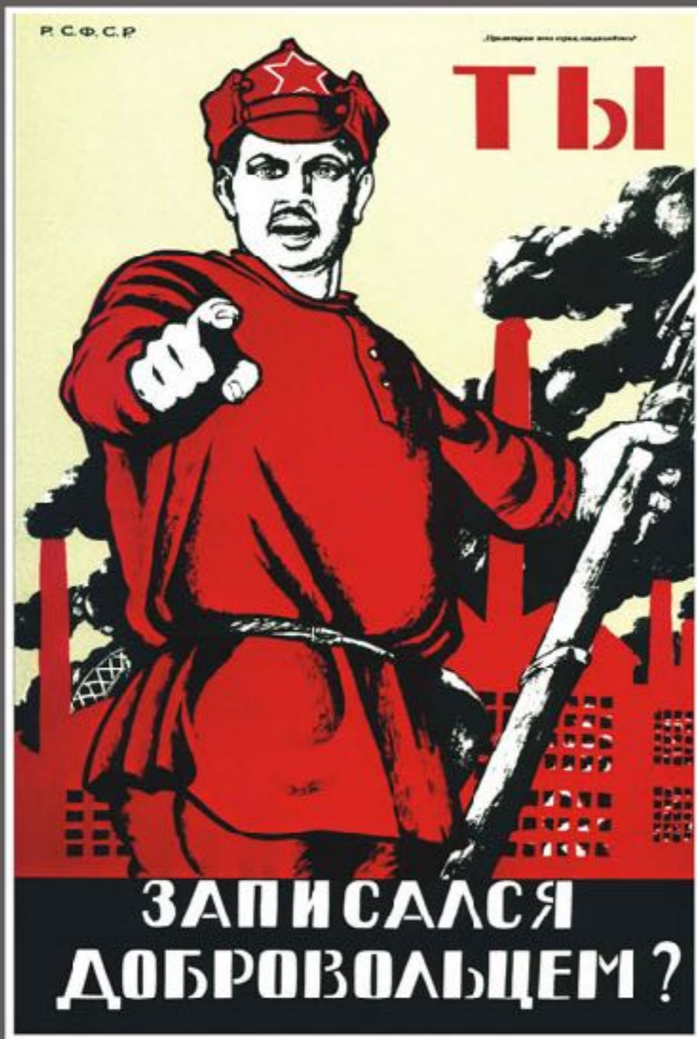
1920 художник Д.С. Мосер плакат

"Москва голодного 1919 года. Заснеженные безлюдные улицы, закопченные дома и яркие плакаты в витринах пустующих магазинов и на площадях. Москвичи привыкли к этим плакатам, называли их "Окнами РОСТА". В то нелегкое время, когда не хватало бумаги и типографии не работали, "Окна РОСТА" заменяли и информационную газету и сатирический журнал, у витрин с плакатами всегда стояла толпа.